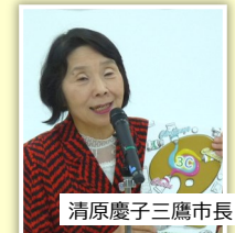
清原慶子三鷹市長