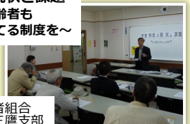
全日本年金者組合 東京都本部三鷹支部