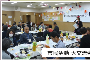
市民活動 大交流会