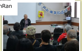
おねえちゃん舎/演劇塾RanRan ×江戸小噺笑い広げ鯛