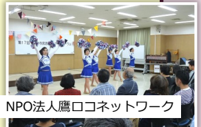
NPO法人鷹ロコネットワーク