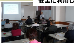
NPO法人シニアSOHO普及サロン・三鷹情報セキュリティ研究会