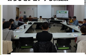
NPO法人 みたか市民協同発電