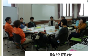
防災団体 やろうよ！こどもぼうさい