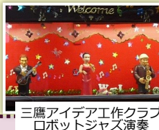
三鷹アイデア工作クラブ ロボットジャズ演奏