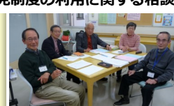
生きがいクラブ武蔵野 × NPO法人多摩東成年後見の会