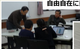
NPO法人シニアSOHO普及サロン・三鷹プログラミング教育ワーキンググループ