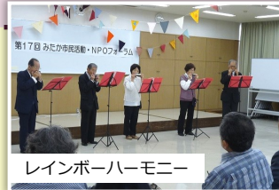
レインボーハーモニー