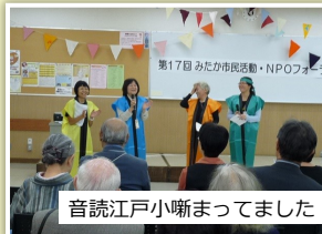
音読江戸小唄まわりました