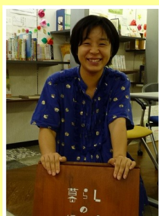
↑笑顔の素敵な方です。