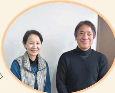
各方面でご活躍の世話役のお二人