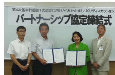
← NPO法人みたか市民協働ネットワークと三鷹市のパートナーシップ協定締結式(7月15日)

※2 「みたかまちづくりディスカッション」は、無作為抽出の市民による討議会として平成18年(2006年)に全国の自治体で初めて実施した取り組みです。「無作為抽出による市民討議会」形式の市民参加手法である「みたかまちづくりディスカッション」の特徴は、市民参加の経験がなかったかたを含め、より広範で多様な市民のみなさんが参加できる点にあります。