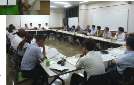
第2回実行委員会(8月10日) →