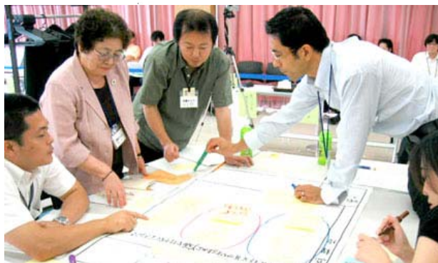
みたかまちづくりディスカッション2006の模擬の様子。

三鷹市では、紙面で紹介できなかった数多くの市民参加によるまちづくりが実施されています。三鷹市広報、三鷹市役所ホームページをご覧ください。