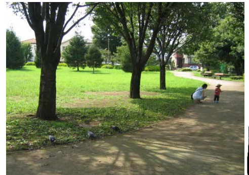
三鷹市芸術文化センターの裏手にある、『連雀中央公園』は、『まちづくりプラン』が実現したもの。広い芝生が美しい憩いの場になっている。