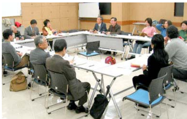
三鷹市市民協働センター企画運営委員会の様子。

運営方針、事業方針の検討及び決定を行います。新たな市民参加の手法の検証にも取り組んでいます。