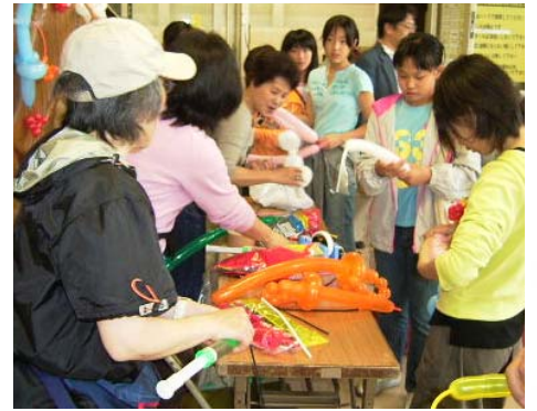
大沢コミュニティ・センターの『コミュニティ祭』の様子。