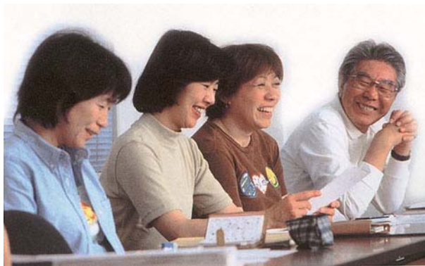
みたか市民プラン21会議の話し合いの様子。