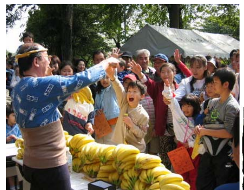
丸池わくわく祭りで行われたバナナの叩き売りの様子。