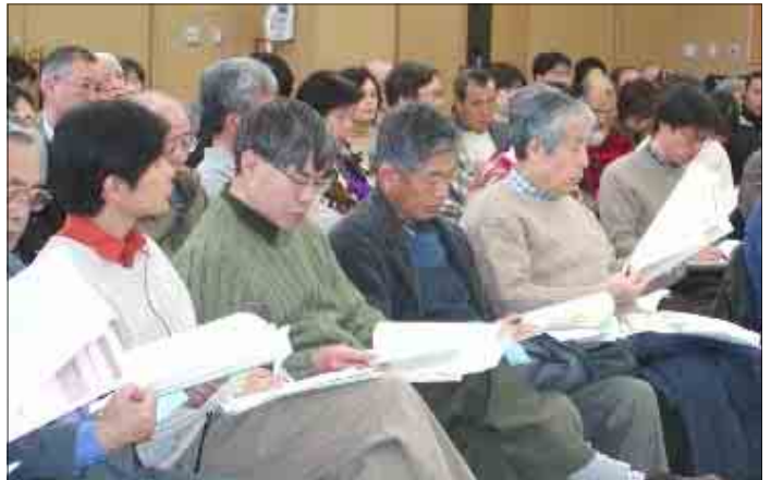
留学生も参加したこのシンポジウム。椅子を追加するほど盛況でした

パネリストから「市民参加」と「協働」の具体例を聞くことができ、具体的な行動のためのよきアドバイスになりました。